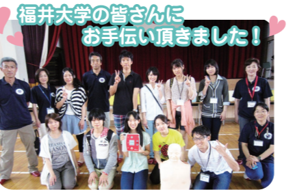
福井大学の皆さんにお手伝い頂きました!

「心肺蘇生法とAEDの操作方法を覚えたいんだけど、どこで教えてもらえるの?」そんなあなたの為に毎月1回定期講習会を行います。ご家族・お友達お誘いあわせの上、是非ご参加ください。(受講料1,000円/名) 場所: 福井駅東 ACOSSA 7階 (福井県福井市手寄1丁目4) ※定期講習会、出張講習会の詳細は命のバトンのホームページでご覧下さい。